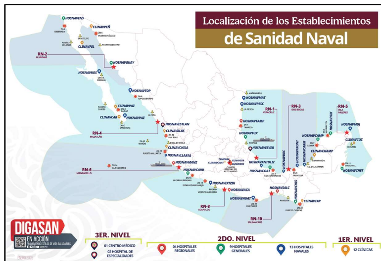
Distribución geográfica de los establecimientos de Sanidad Naval pertenecientes a la Armada de México.